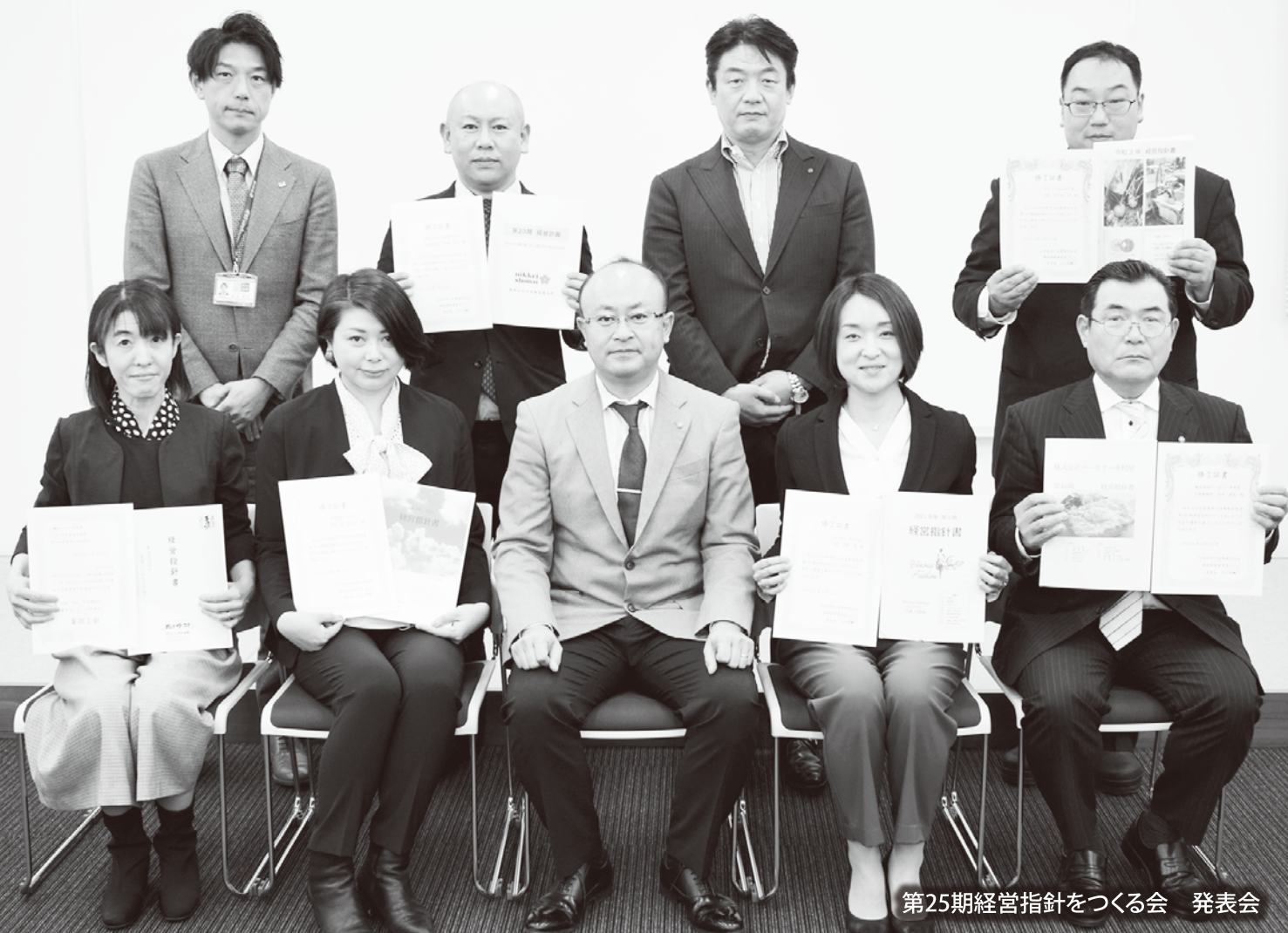
第25期経営指針をつくる会 発表会