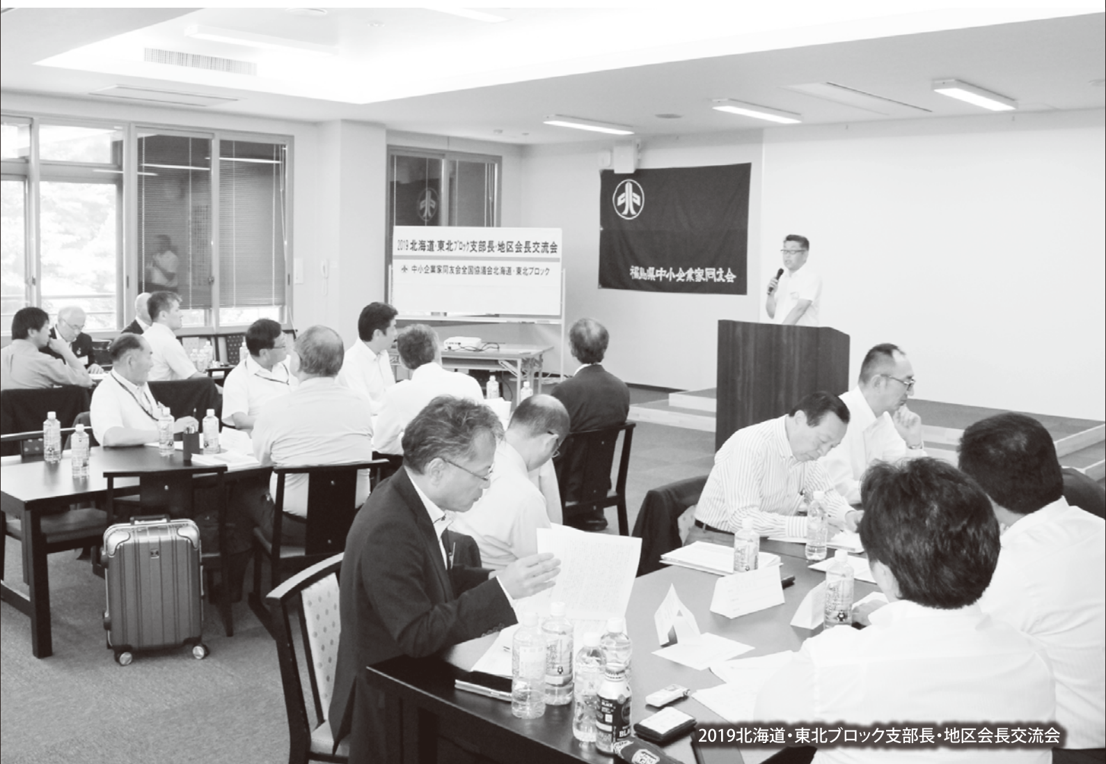
2019北海道・東北ブロック支部長・地区会長交流会